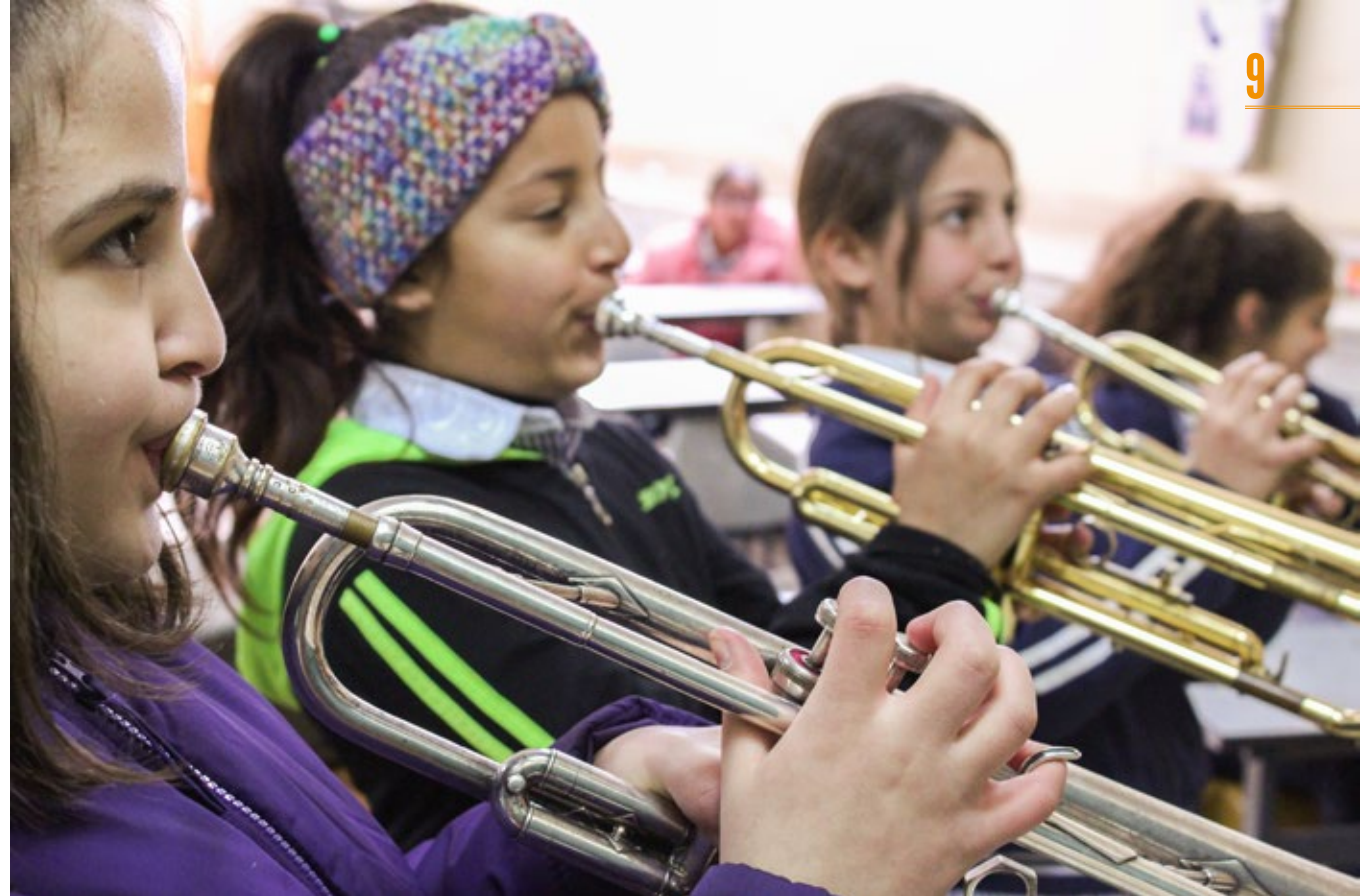
Jeunes ventistes d'Al Kamandjâti