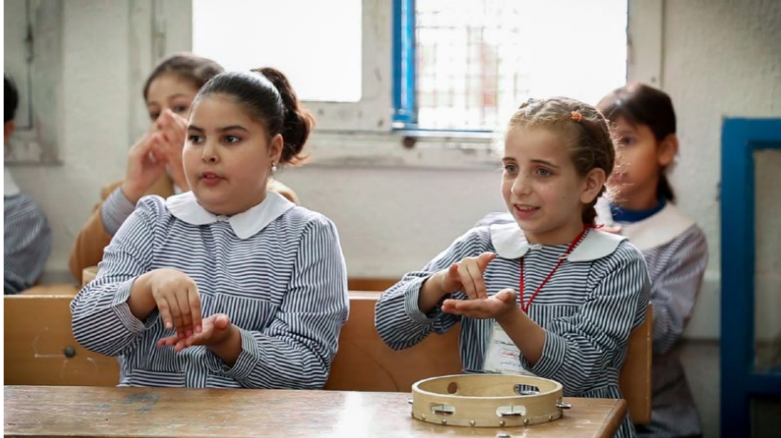
Cours de musique dans une école de l'UNRWA

En 2018-2020 , nous inviterons trois instituteurs chaque année (qui enseigneront ensuite leurs acquis à leurs collègues de Gaza).