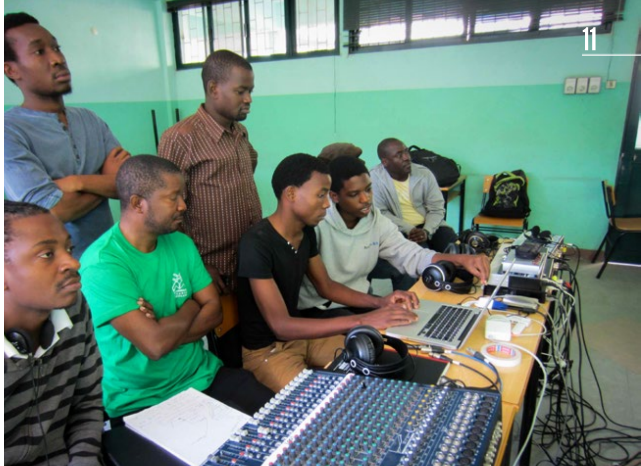
Étudiants de l'École de communication et des arts de Maputo, lors d'un cours d'ingénierie du son