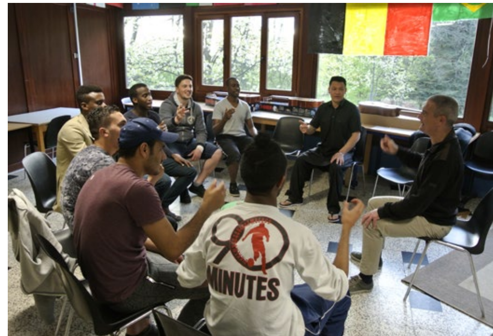
Cours de musique dans un centre de demandeurs d'asile à Manhay